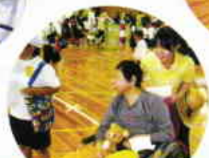
どのゲームが 面白いかな？