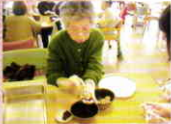
鹿の子饅頭を作りました。