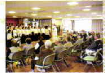
ユーラスボランティア