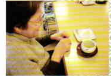
いちご大福を作りました。