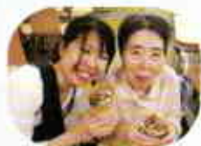
楽しいお茶タイム