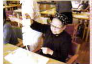
かき餅を作りました。