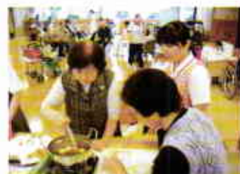
豆腐ドーナツ を作りました。