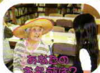
あなたのお名前は？