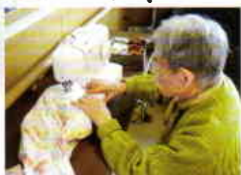
手提げ袋の制作中