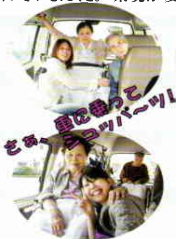
さあ、車に乗って ショッピングへっ！

5月11日と25日に天満屋ハピータウン岡南店へ買い物に行ってきました。本来ならば、11日は後楽園へ出かける予定でしたが、生憎お天気に恵まれず、屋内での買い物に変更しました。参加された皆さん、とても楽しそうに文房具に100均、衣料品や食料品を見て回られました。買い物の後はおやつに店内のフードコートで、それぞれ好きな物を召し上がって頂きました。普段あまり食事がすすまない方も、職員が「そんなに食べてお腹大丈夫？」と驚くくらい、たこ焼きなどを頬張られていました。環境が変わると、違う表情を見せて頂けるなと思った一時でした。