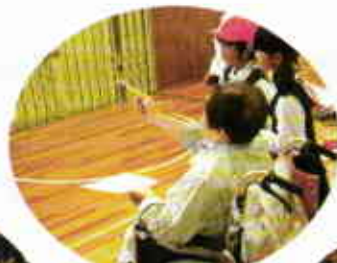
ゲーム 集中をせよ！