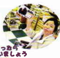
揃ったから お昼もいただきます