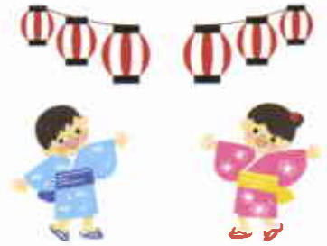
秋祭り会場 病院西駐車場

来る9月28日(土) 17時～19時に病院西駐車場にて、恒例の秋祭りを開催いたします。「広げよう地域の輪、届けよう笑顔の輪」をキャッチフレーズに、スタッフ一同地域の皆様のお越しをお待ちしております。ぜひお誘い合わせの上ご参加ください。