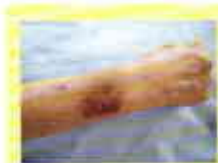
外部刺激による 内出血(皮下出血)

表皮剥離 はくり とは、皮膚を構成している表皮・真皮・皮下組織が、加齢により萎縮し弾力を失い、そして80歳を超える頃には表皮がかなり弱って、まるで熟れた桃のように外部からの刺激ではげてしまうことです。