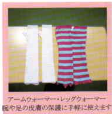
アームウォーマー・レッグウォーマー 腕や足の皮膚の保護に手軽に使えます