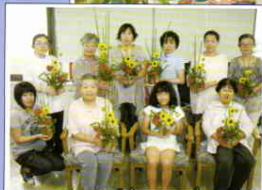
6月15日フラワーアレンジメント教室を開催いたしました！ テーマは「父の日に感謝を込めて。」楽しい教室となりました。