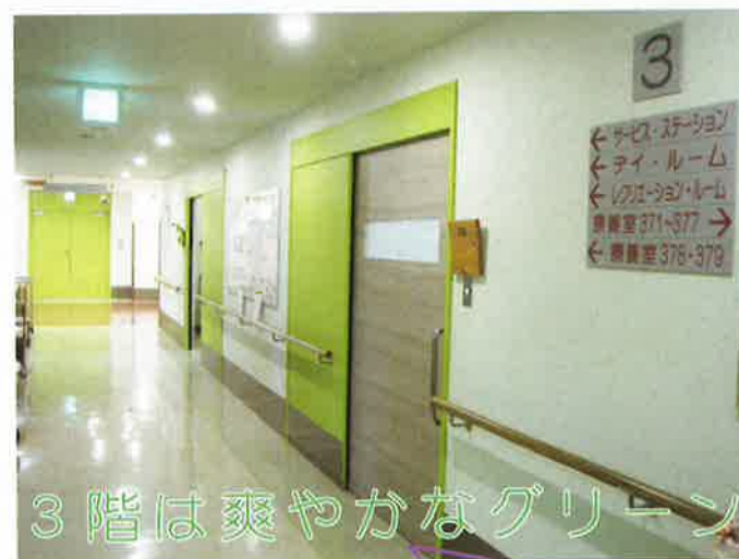
3階は爽やかなグリーン

2階・3階は廊下の壁、照明を一新!! 照明をLEDに変更し、今までよりもずっと明るい雰囲気になりました。