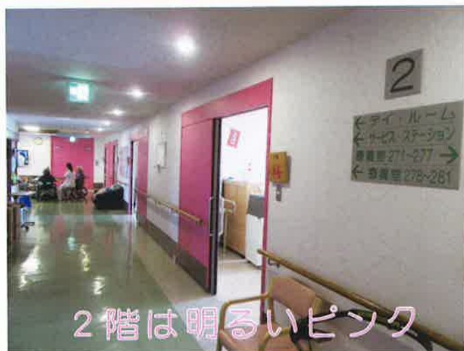
2階は明るいピンク