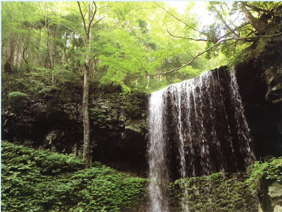
苫田郡鏡野町「岩井滝」