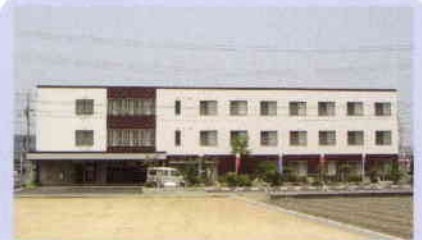
介護付き有料老人ホーム あいらの杜 新保 〒700-0945 岡山市南区新保1315-3 TEL:086-242-2237