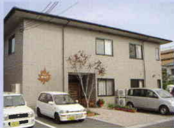
グループホーム かえで 〒702-8038 岡山市南区松浜町7-34 TEL:086-263-0202

株式会社エス・エッチ・メテカルでは、各施設の職員一同、入居者の皆様により良い生活を送っていただける事を心掛けております。入居者の皆様も、毎日を楽しみ過ごされております。施設見学は随時受け付けております。お気軽にお立ち寄り下さい。