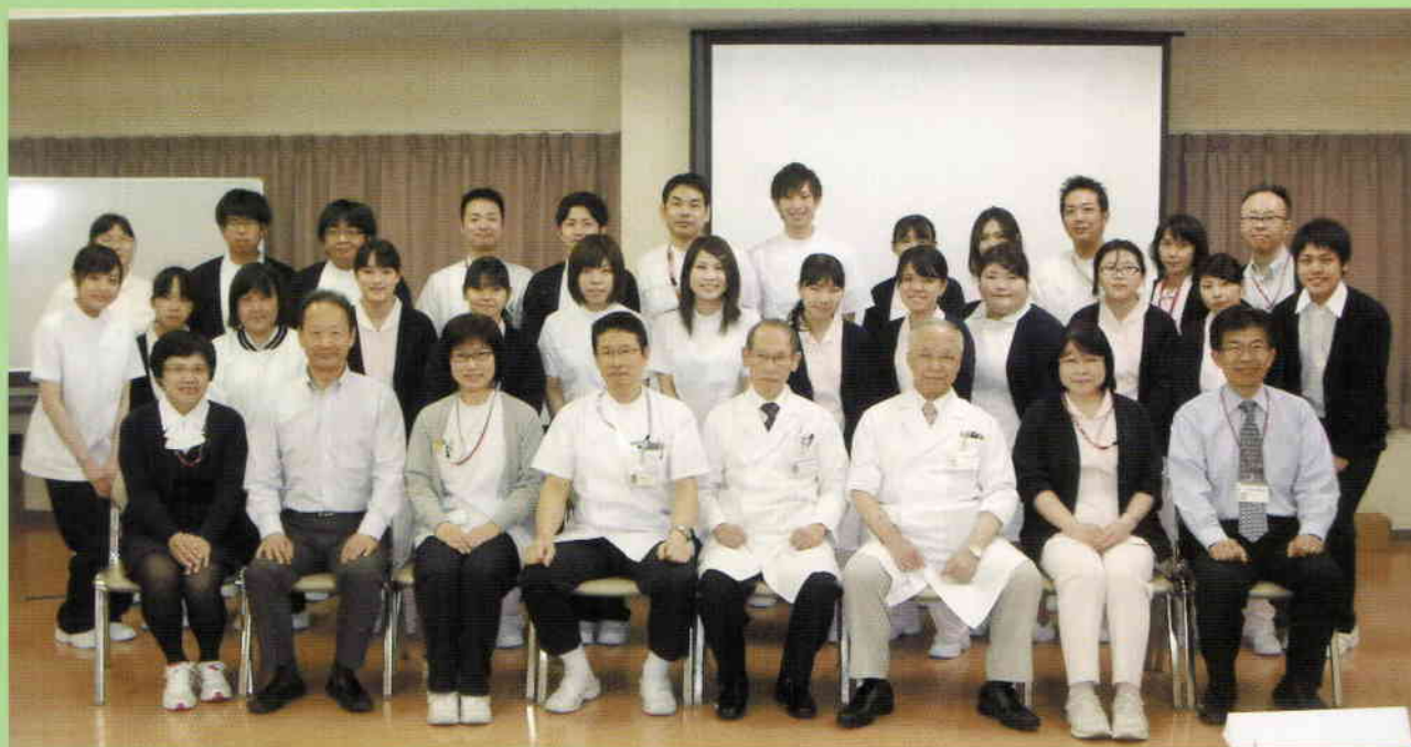
<新人研修会にて 新人19名>