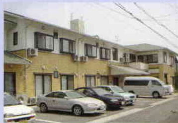
介護付き有料老人ホーム あいらの杜 福吉 〒702-8048 岡山市南区福吉13-12 TEL:086-261-6868