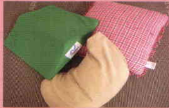
市販で大小・形状とも様々なクッションがあります。これらを使ってこまめに体位を変えることが、褥瘡対策には必要です。