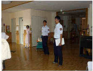
消防署の見守りの中で