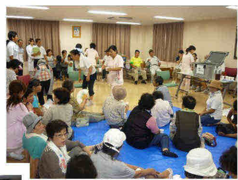
避難後、4階会議室にて お疲れ様～